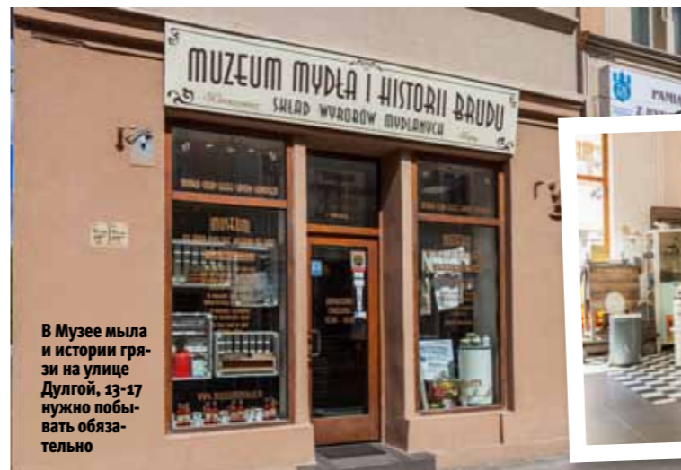
В Музее мыла и истории грязи на улице Дулгой, 13-17 нужно побывать обязательно

Вообще же Быдгощ оставляет впечатление города, увлеченно занятого своим любимым и интересным делом, а гости, по желанию, могут присоединиться или с удовольствием понаблюдать за происходящим. Именно это мы и предлагаем сделать – тебе понравится!