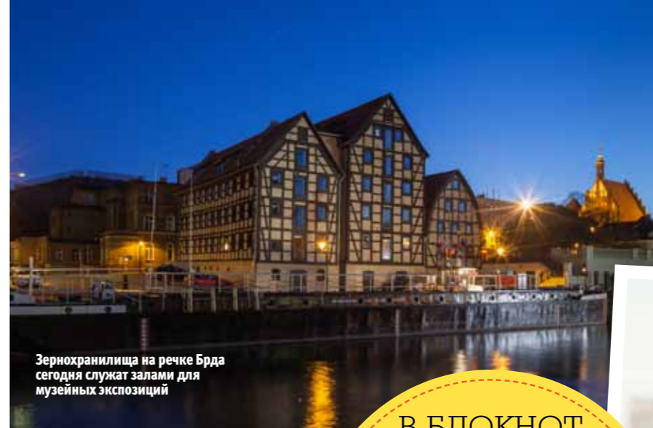
Зернохранилища на речке Брда сегодня служат залами для музейных экспозиций

Ты знаешь, что в Польше есть собственный доктор Фауст? И даже постарше немецкого. Зовут его пан Твардовский. Говорят, он продал душу дьяволу с отсроченным платежом и долго водил нечистого за нос, проявляя завидную смекалку и изобретательность. Что касается финала авантюры, тут версии разные. Вероятнее всего, прав Адам Мицкевич, описавший этот самый финал в стихотворении «Пани Твардовская». Не читала? Рекомендуем, получишь удовольствие. Почему именно Мицкевич? Да потому, что пан Твардовский регулярно два раза в день появляется в высоком окошке дома на площади